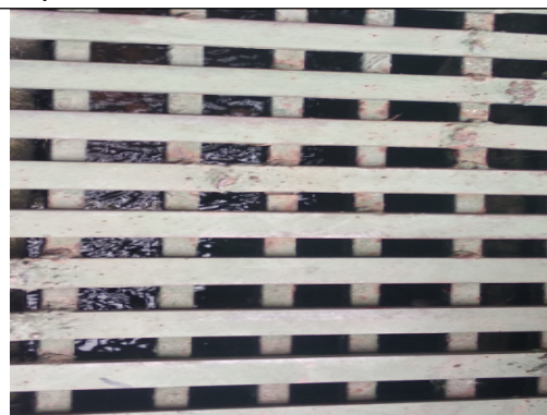
Foto No. 6. Red interna de alcantarillado de aguas lluvias.