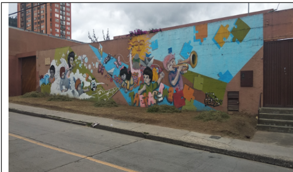
Foto No. 1. Vista fachada actual del predio