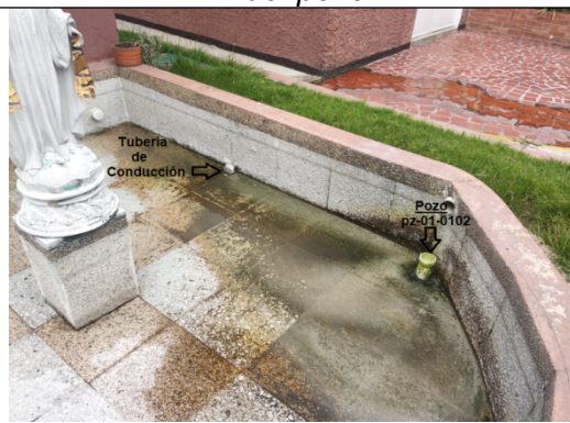
Foto No. 4. Estado alrededor de la boca del pozo