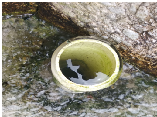
Foto No. 3. Boca del pozo saltante