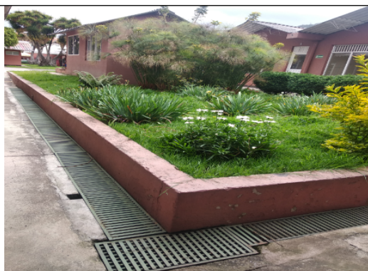
Foto No. 5. Canaletas de conducción agua del pozo