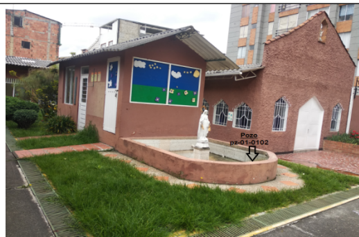
Foto No. 2. Vista general de la ubicación del pozo